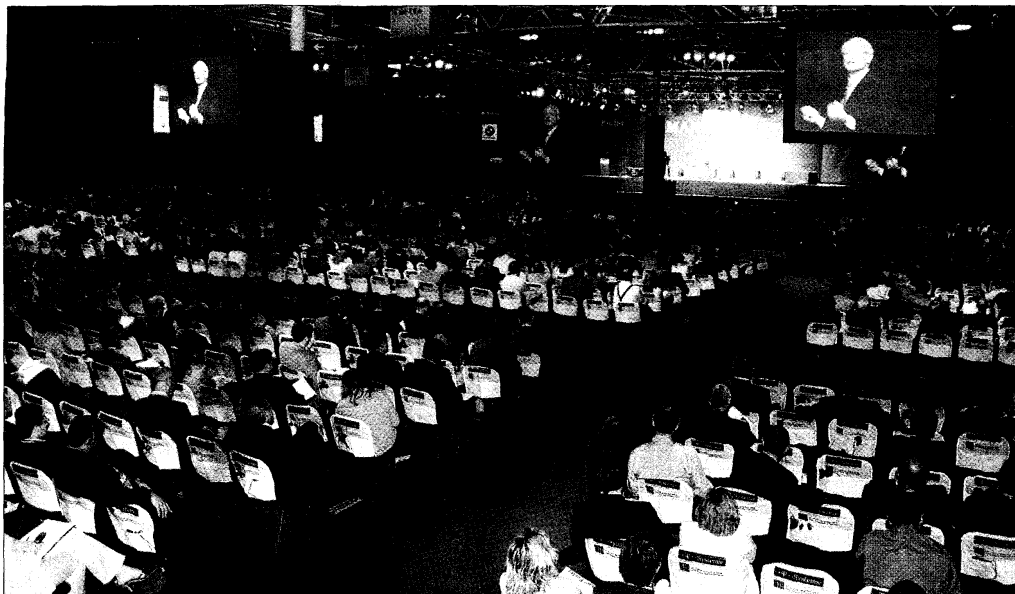
ExpoManagement 2004 abre sus puertas hoy hasta el jueves día 19 de mayo, en el parque empresarial Juan Carlos I de Madrid.